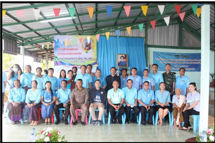
งานพิธี ผ้าป่าสามัคคีสมทบ กองทุนแม่ของแผ่นดิน ๒๕ พ.ย. ๒๕๖๕