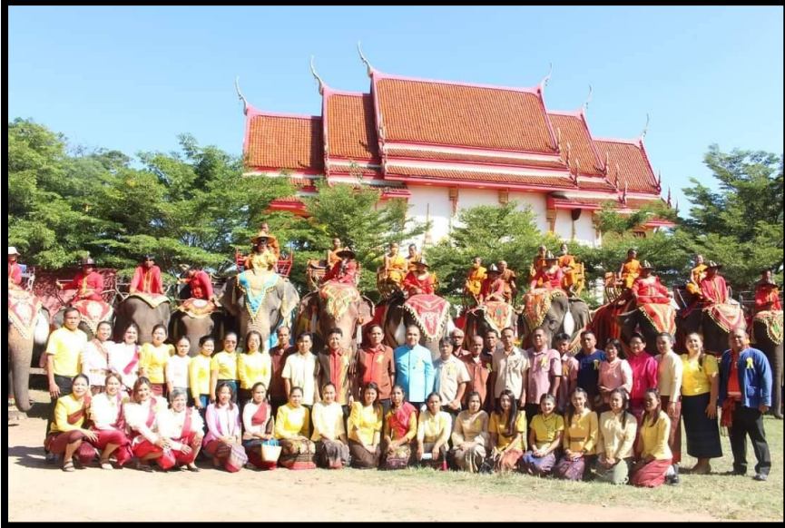
เทศกาลศิลปวัฒนธรรมพื้นบ้าน นานาชาติแห่งประเทศไทย ๓ พ.ย. ๒๕๖๕

๑. พัฒนาด้านการจัดการความรู้ เพื่อสร้างวัฒนธรรมการเรียนรู้ การถ่ายทอดความรู้ การแลกเปลี่ยนความรู้ และประสบการณ์ในการทำงานอย่างต่อเนื่อง